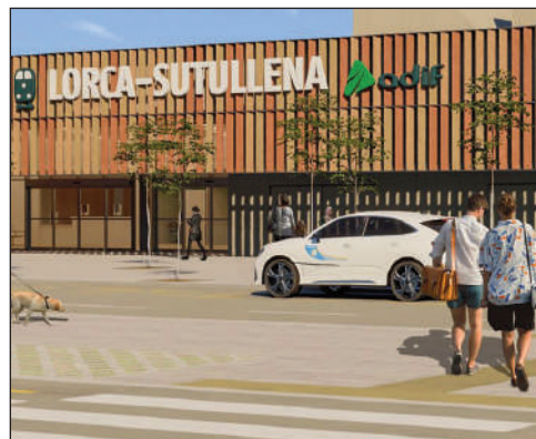
Así será la estación de Sutullena.