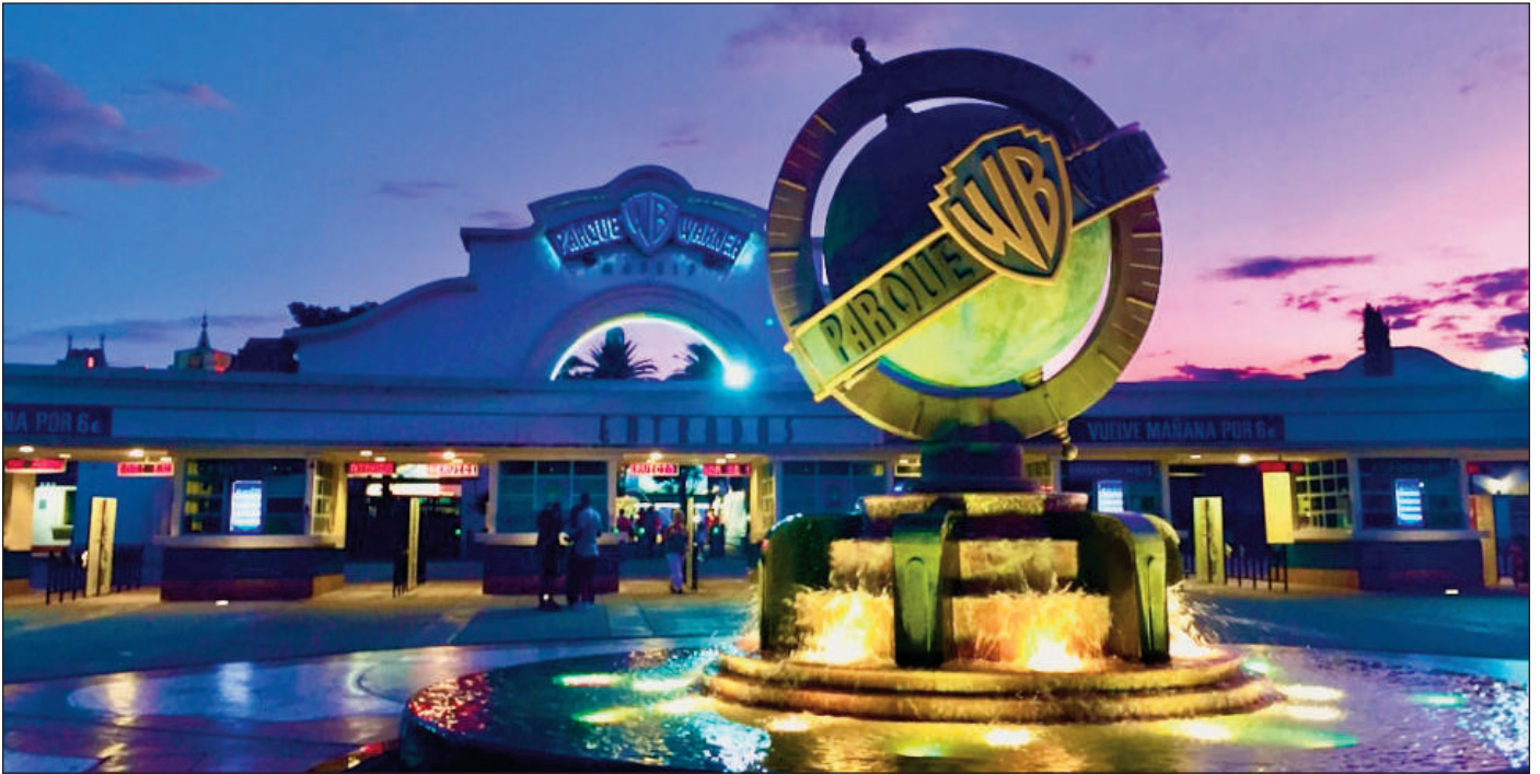
Nuestro alumnado visitará el Parque Warner.