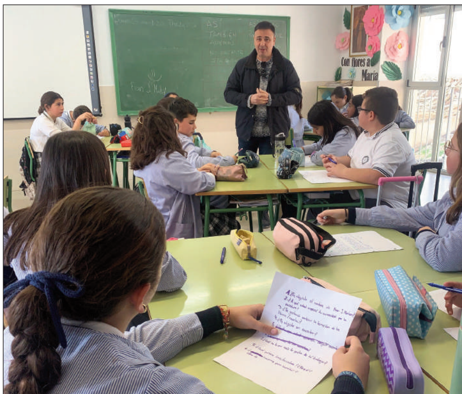
El autor lorquino, el pasado jueves 23, en nuestras aulas.

Hace poco rodó en Lorca, en una cocina. Dijo que esa película en la que está traba-