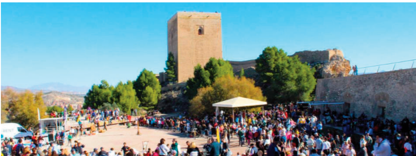
El Castillo de Lorca se llena de animación, cada año, con motivo del día de su patrón