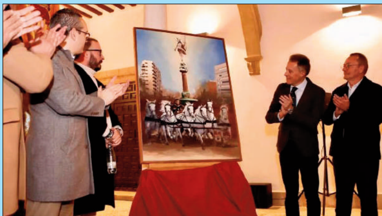
El Cartel de la Semana Santa 2025, tras darse a conocer.